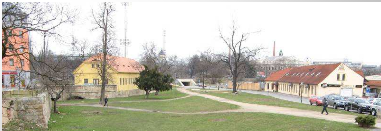
Mlýnská strouha listopad 2008 – zahájení stavby