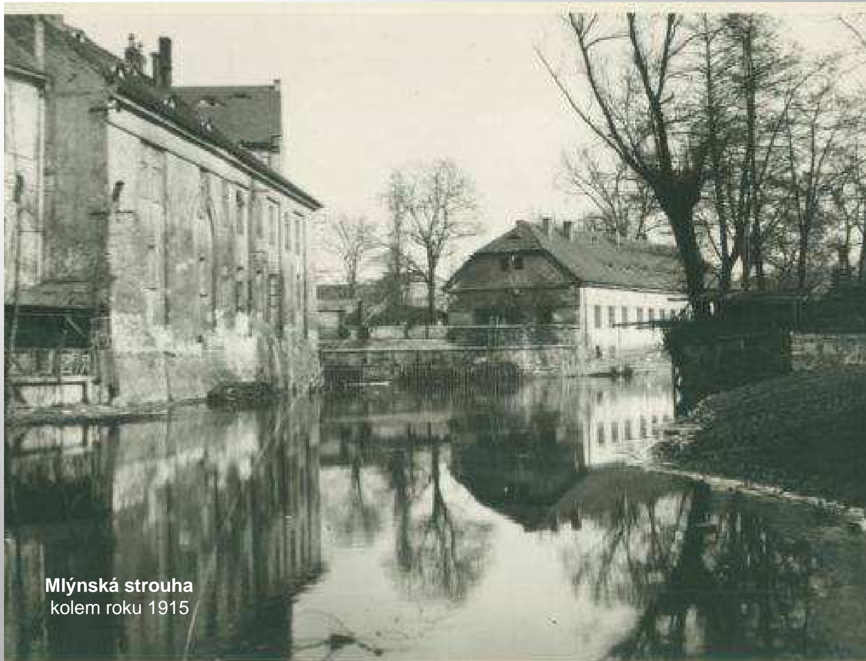
Mlýnská strouha kolem roku 1915