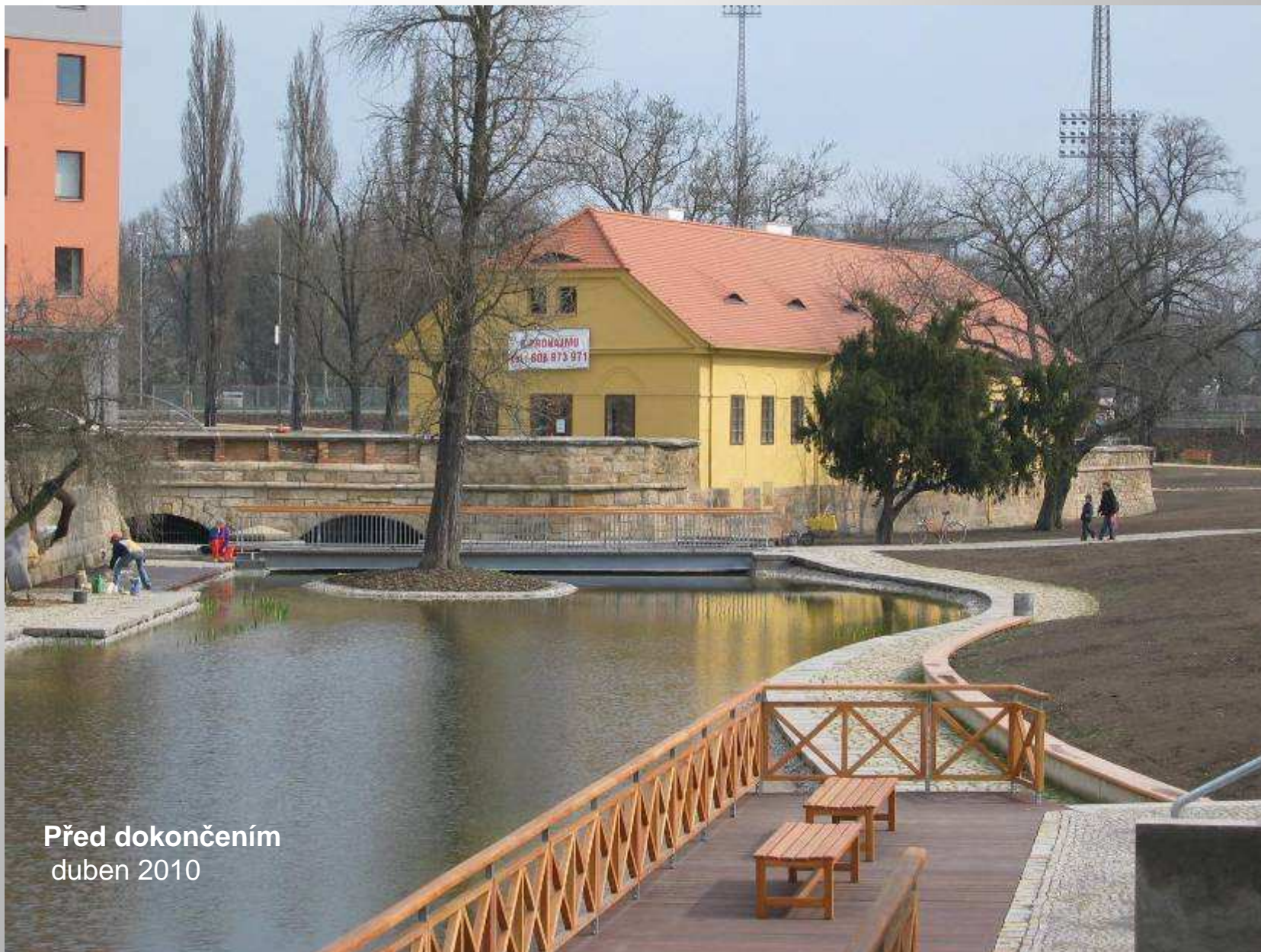
Před dokončením duben 2010